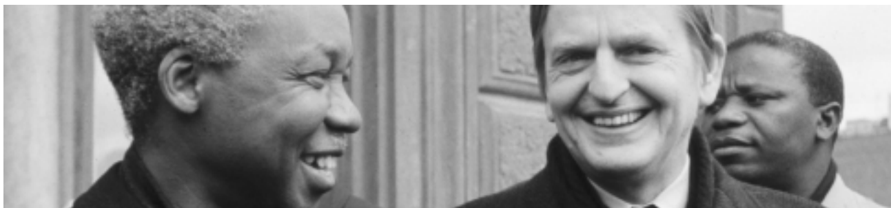
Sverige hade tidigare en särställning i många afrikanska länder. Julius Nyerere, det självständiga Tanzanias första regeringschef och första folkvalda president (1962), deltar här i en förstamajdemonstration i Stockholm 1976 tillsammans med Olof Palme.

Siffrorna från det år när den registrerade flyktingströmmen nådde sin höjdpunkt, 1992, belyser ännu tydligare Sveriges särställning. Detta år registrerades 84 000 asylsökande. Bara Tyskland överträffade den siffran bland europeiska stater: 438 200 (året därpå ändrade tyskarna den mycket liberala asylslag som upprättats i reaktion mot Hitlertiden vid Förbundsrepublikens grundande 1948). Danmark hade detta år 13 900 asylsökande, Norge 5 200, Finland 3 600, Holland 17 500, Storbritannien 32 300 och Frankrike 26 900.